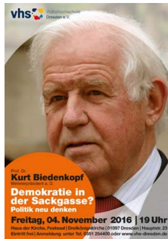
Grundfragen der Zeit: mit Prof. Dr. Kurt Biedenkopf