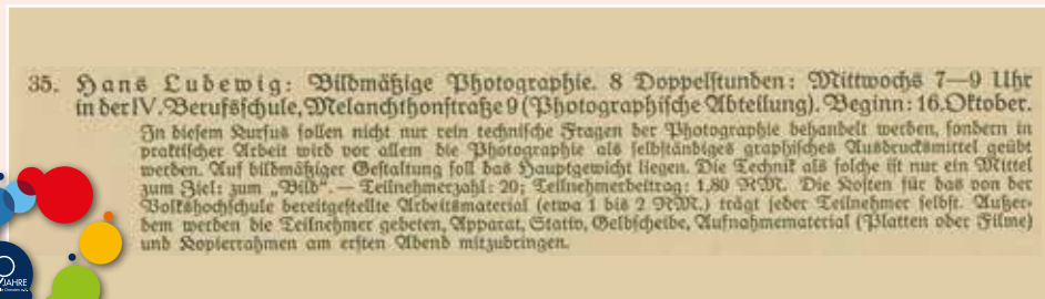
Auszug aus dem unserem Programmarchiv von 1928